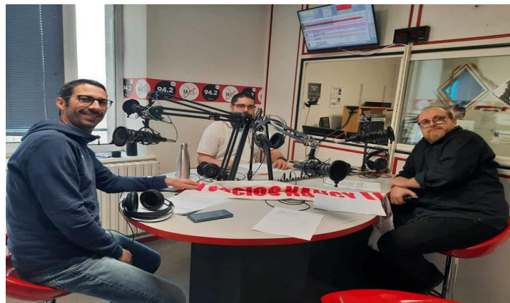
Rapport d'activités 2023/2024